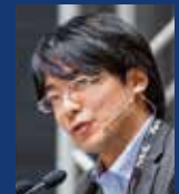
広瀬 一郎 (内閣官房情報通信技術 (IT)総合戦略室)